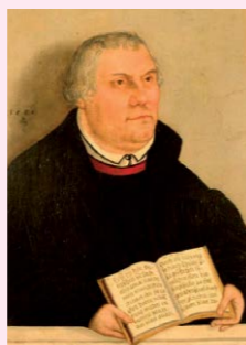
Martin-Luther-Gemälde von Lukas Cranach d. J.