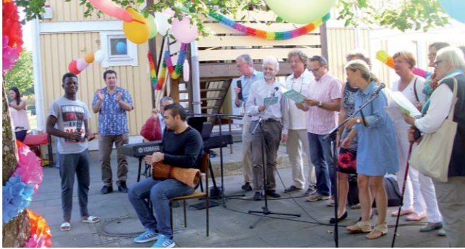
Gemeinsames Singen in Sieversstücken

Anmeldung erbeten: Tel. 866250-0, kirchenbuero@blankenese.de