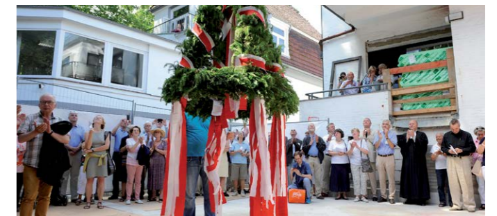
Richtfest im Emmaus Hospiz