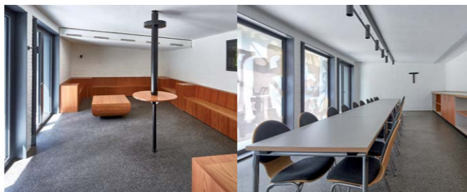
Renovierte Warteräume auf dem Friedhof