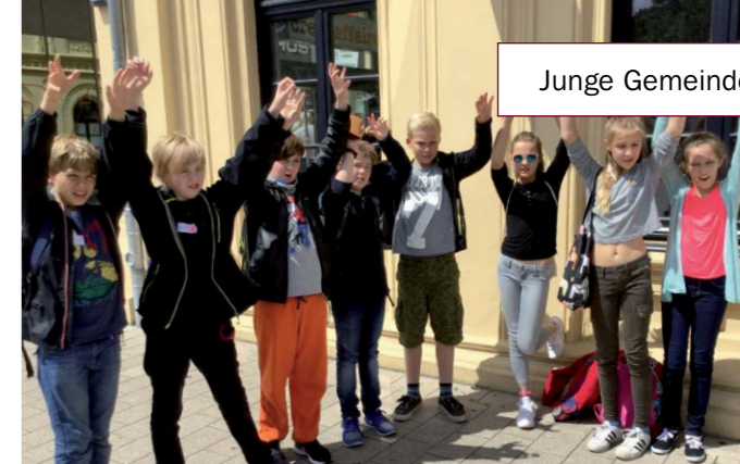
Neues Streitschlichter-Team der Bugenhagenschule

Vor den Ferien haben sich acht SchülerInnen der Klassenstufen 5 und 6 von zwei Sozialpädagoginnen und einer FSJ-lerin der Schule als Streitschlichter ausbilden lassen. In einer Stunde pro Woche haben sie sich mit dem Thema „Konflikte in der Schule“ beschäftigt. Sie haben trainiert, wie man Gespräche moderiert, Sichtweisen versteht und zugrundeliegende Gefühle erkennt, wie man andere bei der Lösungsfindung unterstützt und wie die eigene Rolle einzuschätzen ist. Es blieb nicht bei der Theorie – mit viel Spaß und Kreativität haben die SchülerInnen diese Aspekte im Rollenspiel umgesetzt. Nach bestandener Prüfung haben sie am Hamburger Streitschlichtungstag teilgenommen und im Austausch