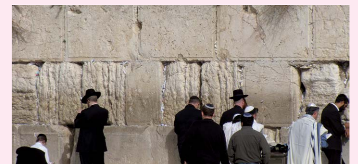
Betende Juden an der Klagemauer

Weitere Treffen: bis Juli 2017 monatlich jeweils am letzten Freitag, nicht im Dezember | Anmeldung bis Ende September: Tel. 866250-25, klaus.poehts@blankenese.de