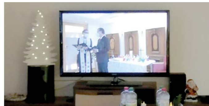
Gottesdienst an Weihnachten im Stift – live auf dem Bildschirm