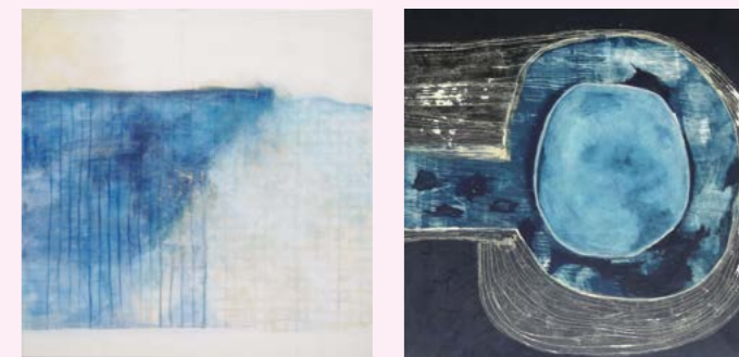
Monochord und Dynamik, 200 x 200 cm, Eitempera, Schellack, Wachssalbe auf Leinwand, 2014

Leider ist es immer noch nicht abzusehen, ab wann regelmäßige Chorproben wieder werden stattfinden können. Nach den jüngsten Entwicklungen der Pandemie ist das vor Ostern kaum mehr zu erwarten. Deshalb müssen wir die für Karfreitag geplante Johannes-Passion von Heinrich Schütz wieder absagen. Sollten jedoch Präsenzgottesdienste in der Kirche unter Einhaltung der Hygienekonzepte mit wenigen Besucherinnen und Besuchern wieder stattfinden dürfen, sind zwei Andachten geplant, in denen die Orgel im Mittelpunkt steht.