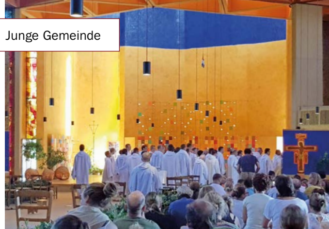
Gottesdienst in Taizé