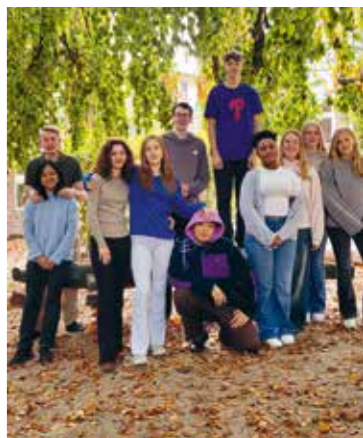
Frisch ausgebildete Teamer:innen

Im Oktober haben sich elf Jugendliche auf den Weg gemacht, Teamer:innen zu werden. Auf einem ganztägigen Workshop mit dem Titel „Next Level“ haben sie sich mit ihren Stärken und Fähigkeiten beschäftigt und darauf geschaut, wo sie sich gut in der Konfi-Arbeit einbringen können. Sie haben gelernt, welche Aufgaben und Verantwortung Teamer:innen tragen und beispielhaft erprobt, mit schwierigen Situationen umzugehen. Sie wurden sensibilisiert für achtsames Verhalten in Machtpositionen und haben erste eigene Erfahrungen im Anleiten von Gruppen gesammelt. Im November haben vier von ihnen zum ersten Mal eine Konfi-Freizeit begleitet und unser Team bereichert. Die übrigen werden sich im Frühjahr 2025 ausprobieren dürfen. Wir freuen uns über diese tolle Verstärkung für unser Team!