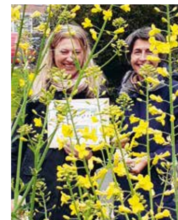
Beeterinnen auf dem Kirchvorplatz