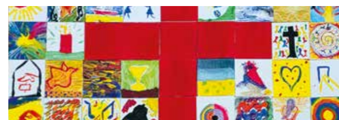
Viele einzelne Bilder, gemalt auf dem Ehrenamtlichen-Fest im Juni, ergeben ein buntes, vielfältiges Ganzes, unsere Gemeinde (Ausschnitt)

Ich kann nur erahnen, wie viele Leben sie damit berührt hat, wie viel Anstoß zur Veränderung sie in den letzten fünf Jahren gegeben hat und hoffe, dass ich noch lange die Wellen ihres Wirkens bei uns spüren werde. Nun verlässt sie uns und ich bedauere als Kollegin und KGR-Mitglied von Herzen, dass wir diese Projektstelle nicht verlängern konnten. Was uns bleibt, sind die Projekte,