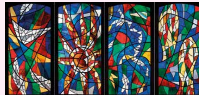
Tatiana Ahlers-Hestermann, Kapelle des Kinder- u. Jugendhauses St. Elisabeth, Bergedorf, 1977

Eintritt: 5 € | Im Rahmen der Ausstellung „Leuchtende Schätze – Kirchenglasmalereien in Hamburg und Schleswig-Holstein“