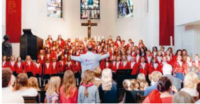
Blankenäschen in der Kirche am Markt, Dezember 2023

Sanfte und leise Töne bestimmen das diesjährige Weihnachtskonzert der Blankenäschen – denn laut genug war es um die Blankenäschen, Markenzeichen der Stadt Hamburg und beheimatet an der Elbkindergrundschule, im Jahr 2024 ganz bestimmt. Im Oktober wurde es überall publik: Helene Fischer, Deutschlands