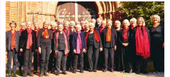
Cantus Blankenese vor dem Ratzeburger Domportal