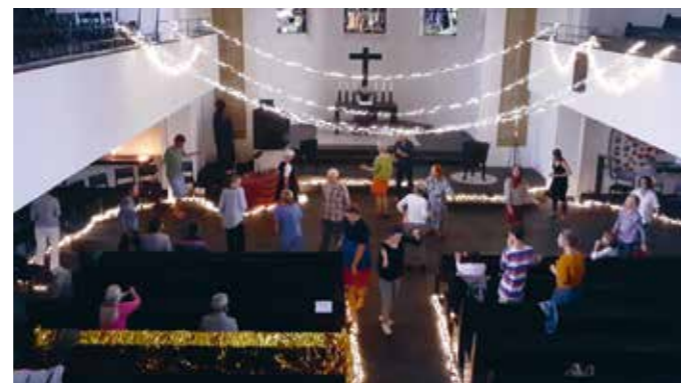
Resonanzraum – Tanzen durchs Kirchenschiff

Nicholas Brautlecht, SoLawist und Initiator des Resonanzraumes