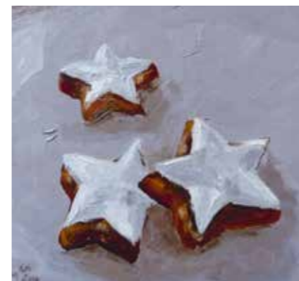
Zimtsterne, Ölbild von Maren Goericke, Kunstverein Blankenese e.V.

Am zweiten Adventswochenende ist im vorweihnachtlich geschmückten Gemeindehaus vielerlei Kunst zu entdecken,