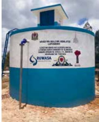
Frischwassertank in Lupombwe