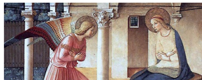
Fra Angelico, Mariae Verkündigung, 1437/46