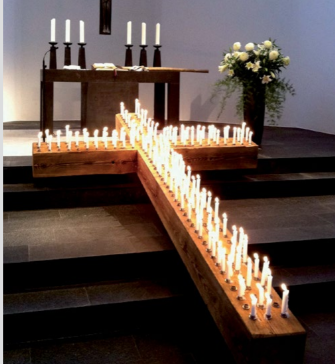
Ewigkeitssonntag: Lichterkreuz im Altarraum

www.theparentscircle.org | Spendenkonto: Ev.-luth. Kirche am Markt HypoVereinsbank, DE72 2003 0000 0006 6040 41, Stichwort: Parents Circle