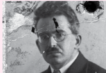
Passbild von Walter Benjamin aus dem Jahr 1928

Lesung zur Erinnerung an den Philosophen Walter Benjamin